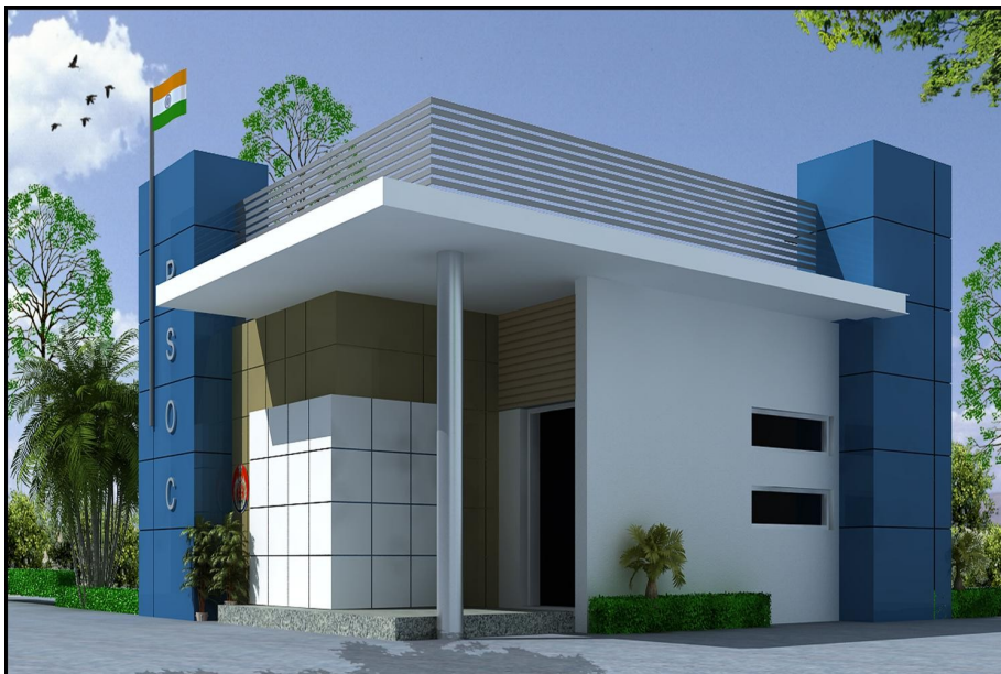
3. Police Station SAANJH Kendra