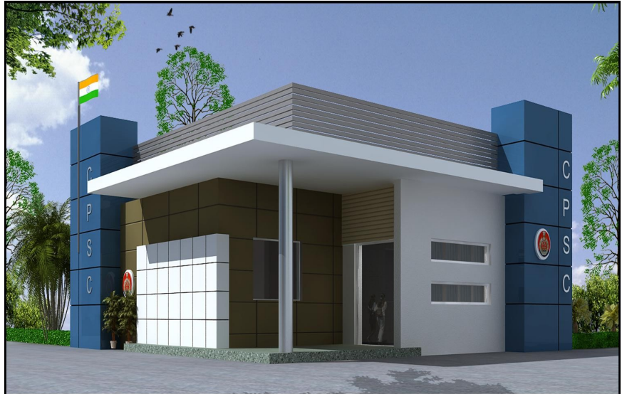
2. Sub-division SAANJH Kendra